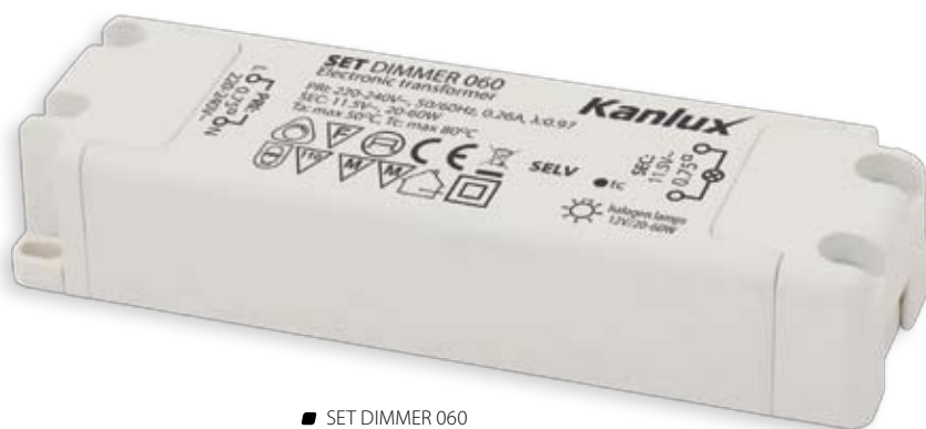
■ SET DIMMER 060